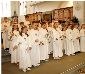
Erstkommunionkinder und Kreuz 2025.