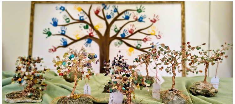
Selbst gestaltete Drahtbäumchen.