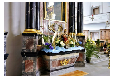
Marienaltar in der Pfarrkirche.

Wir laden die Besuchenden der Dienstagsgottesdienste herzlich ein, neu im vorderen Bereich beim Ma- rienaltar Platz zu nehmen. So möch- ten wir die FeiERGemeinschaft be- wusst stärken. Vielen Dank.