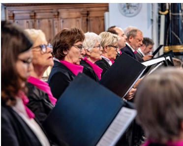
Gemeinschaft musikalisch pflegen.

Gastsängerinnen und Gastsänger sind herzlich eingeladen! Kommen Sie unverbindlich vorbei und lernen Sie unseren Chor kennen. Die Proben finden ab 6. Mai jeweils am Mittwoch von 19.30 bis 21.15 Uhr im Pfarreizentrum statt.